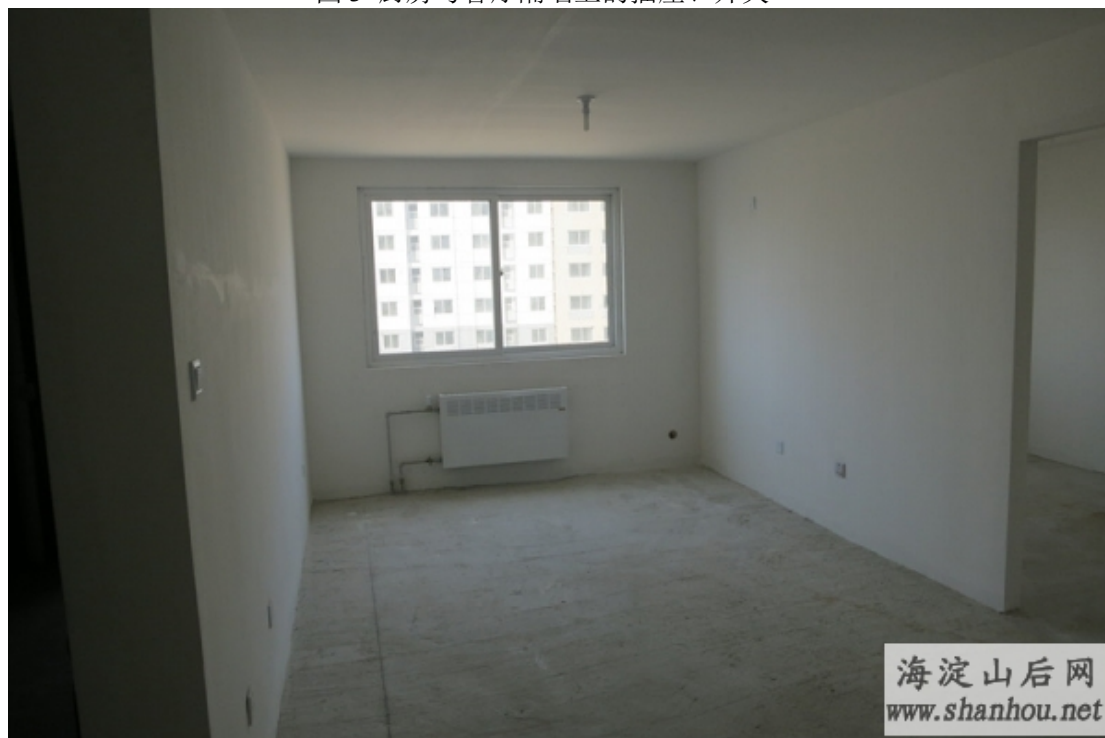
图3 厨房与客厅隔墙上的插座、开关

4. 拆除厨房与客厅的隔墙后，计划将煤气灶、油烟机放在厨房的阳台上，做成个小的封闭式炒菜厨房，洗菜盆、橱柜、台面，以及原放在厨房阳台的洗衣机，做成如图4中所示的半封闭式厨房。问题是洗衣机挪至台面、橱柜这边后，所需的下水水管、地漏等是否好施工、安装，再有就是下水管道会不会异味呢，因是厨房的下水管路再加上半封闭式厨房，若有异味的话，直接导致真个客厅也会有股怪怪的味道。