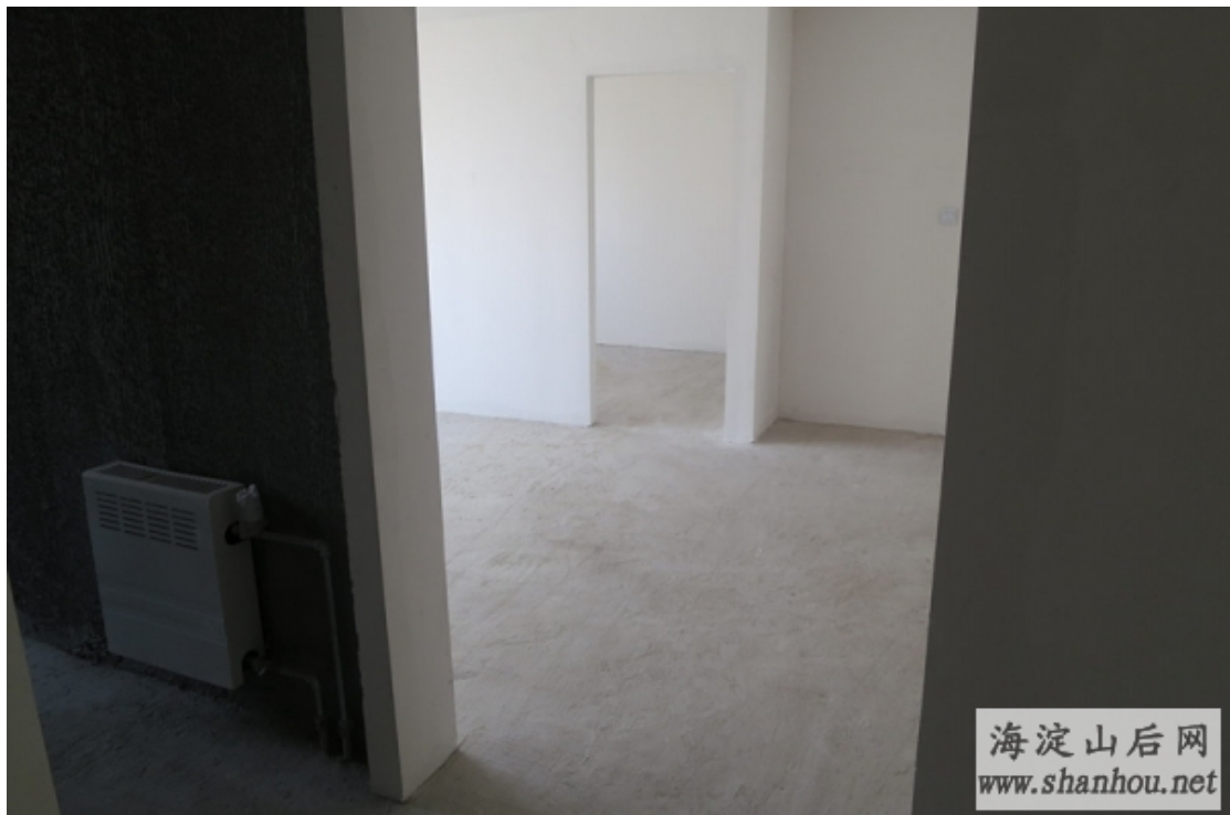
图2 卧室与厨房的隔墙

如图 2 中的暖气片，能否将暖气管路加长，将暖气片挪至门洞左侧的墙根下，没记错的话应在门禁电话的下方。不知装修时，能否改平、加长暖气管路至左侧墙根下？