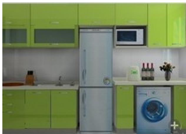
图4 计划中的半封闭式厨房

4. 拆除厨房与客厅的隔墙后，计划将煤气灶、油烟机放在厨房的阳台上，做成个小的封闭式炒菜厨房，洗菜盆、橱柜、台面，以及原放在厨房阳台的洗衣机，做成如图4中所示的半封闭式厨房。问题是洗衣机挪至台面、橱柜这边后，所需的下水水管、地漏等是否好施工、安装，再有就是下水管道会不会异味呢，因是厨房的下水管路再加上半封闭式厨房，若有异味的话，直接导致真个客厅也会有股怪怪的味道。